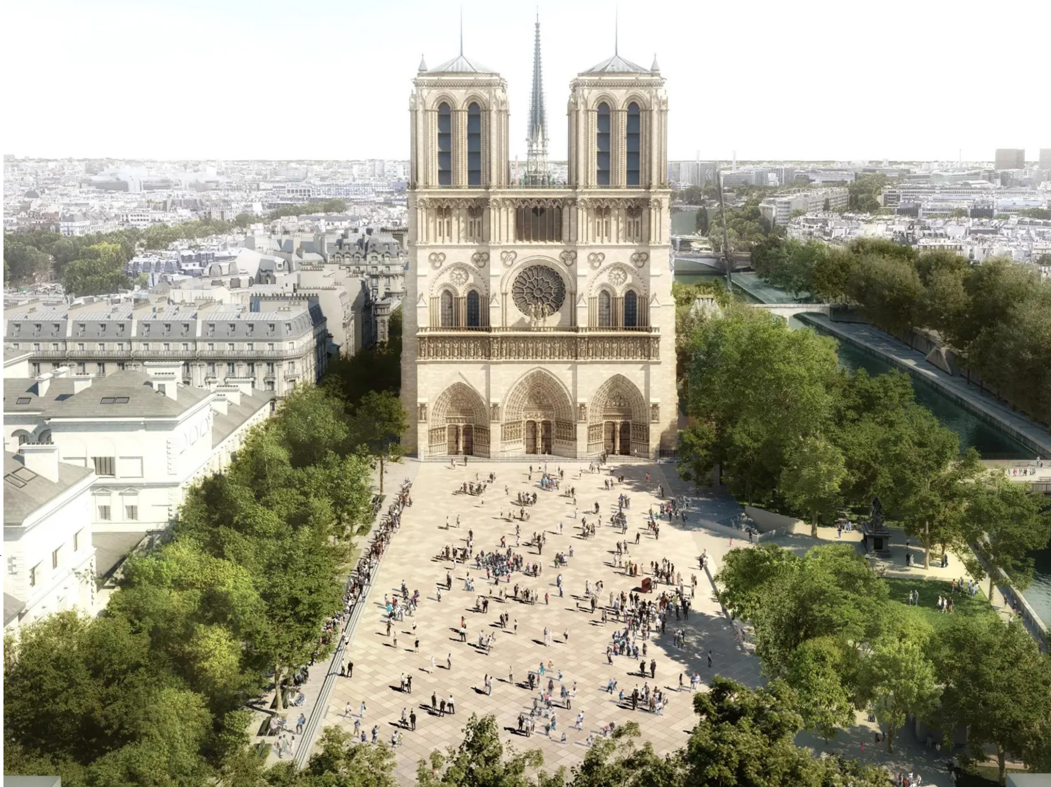
Paris Les Abords de Notre-Dame de Paris, Burea Bas Smets